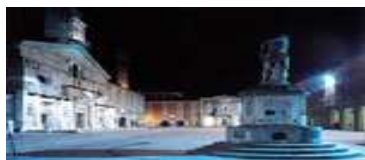
Piazza Prampolini Reggio Emilia

Il programma comprende anche paratiroidi e linfonodi. Esso mantiene il caratteristico orientamento pratico: dimostrazioni "dal vivo" in videoconferenza interattiva, brevi premesse, ampie esercitazioni.